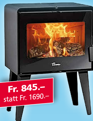
ALVA WOOD 1LC 850 x 700 x 400